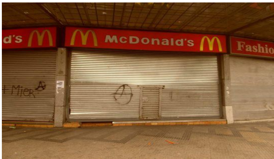
Fotografía del McDonald's atacado durante la protesta del día 18/10/2014.

...En el recuerdo vivo y en la acción por la Liberación Total!!!